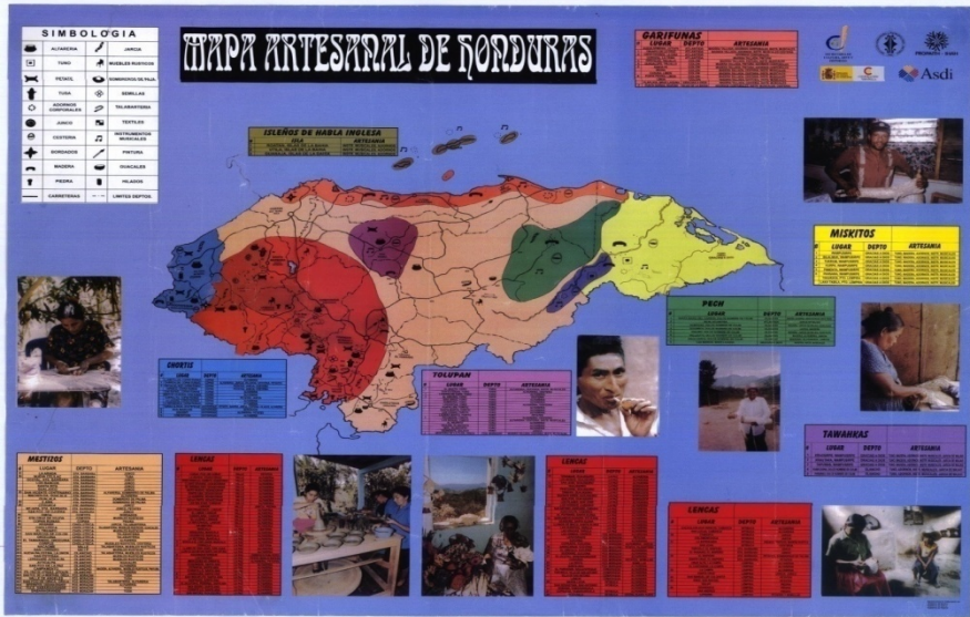
Fig. 3. “Mapa Artesanal de Honduras”, 1998-1999